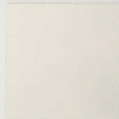
cm 25 x 25 (10"x10")

A collection of indoor floor and wall tiles made of rectified glazed stoneware, including fourteen matt colours in three categories - neutral, background and accent colours - and available in three different sizes. The choice of a solid matt colour giving the collection a silky consistency is enriched with a material texture recalling the weave of printed canvas stamped into the tile: subtle, almost imperceptible variations encouraging the onlooker to approach the tile and discover all its unique details. All Pittorica shapes and sizes, square 25x25 cm - rectangular 6x25 cm and triangular 25x25x35 cm, with a thickness of 10 mm - can be mixed and matched to permit complex, creative decorative schemes. The decorative properties of Pittorica are enhanced by the new rectified formats, which guarantee laying solutions with minimal joints for both floors and walls, bringing out the full, modern spirit of colour expressiveness.