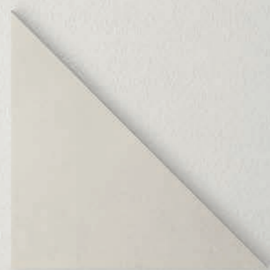
cm 25 x 25 x 35 (10"x10"x14")