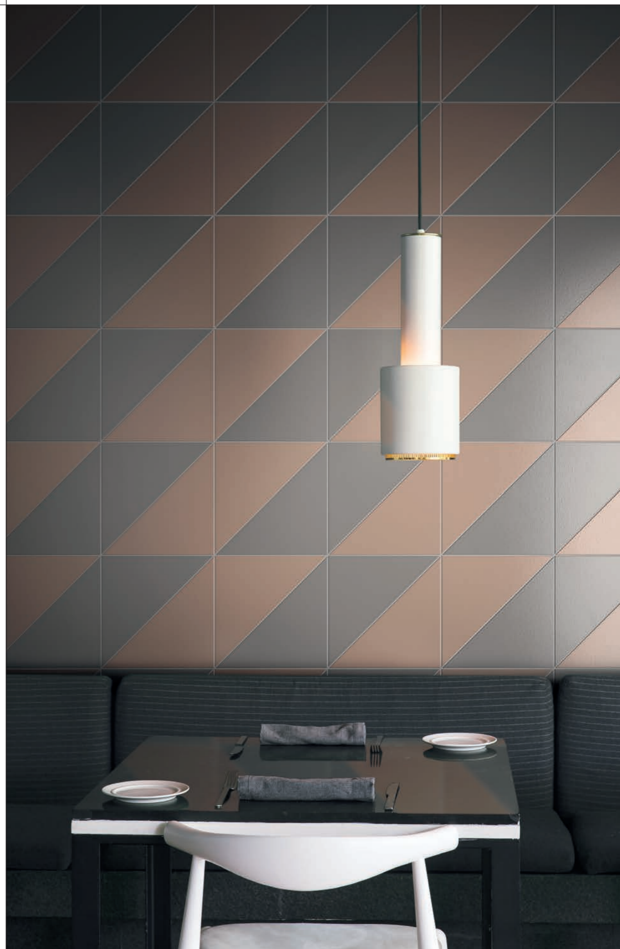
LIVING, rivestimento / covering PITTORICA 6/M-7/M-8/M-9/M-14/M (cm. 25x25x35 - 10"x10"x14")