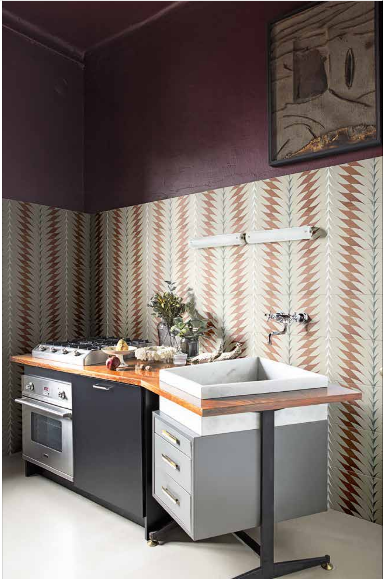
CUCINA/KITCHEN, FLEURS 2A-2B Rivestimento posa a campo pieno / Covering, all over layout