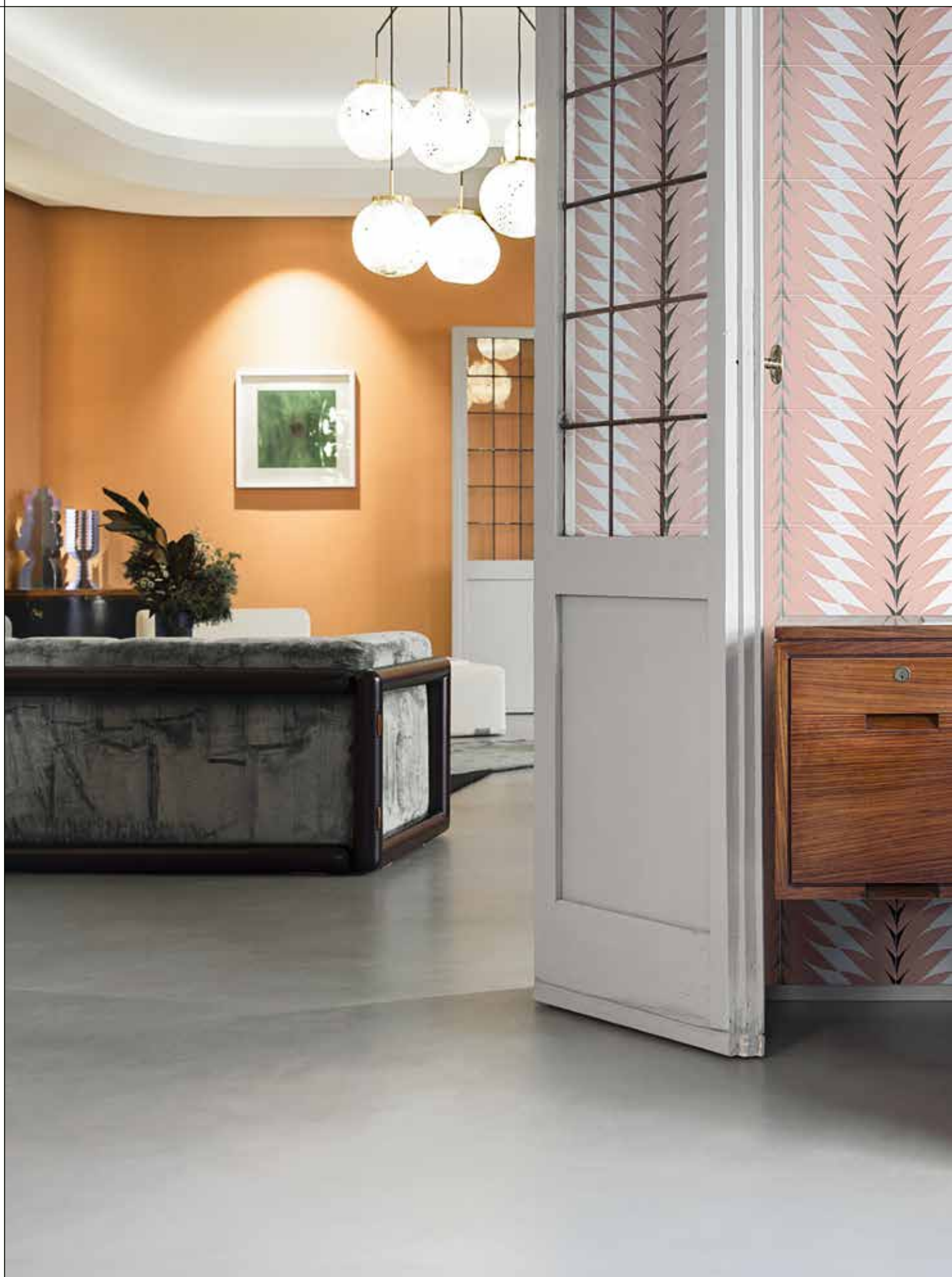
LIVING, FLEURS 3A-3B Rivestimento posa a campo pieno / Covering, all over layout