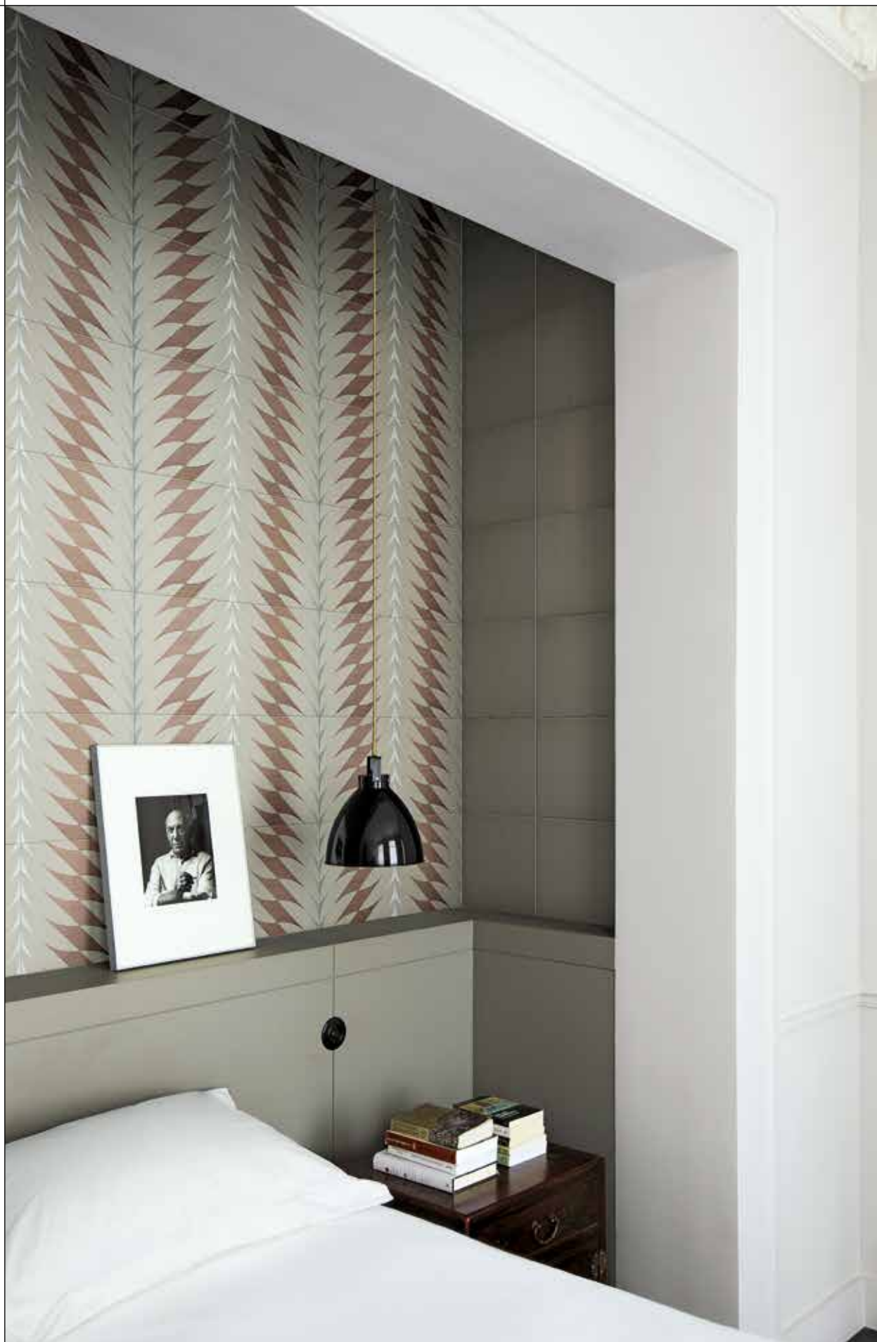
CONTRACT, FLEURS 2A-2B-2F Rivestimento posa a campo pieno / Covering, all over layout