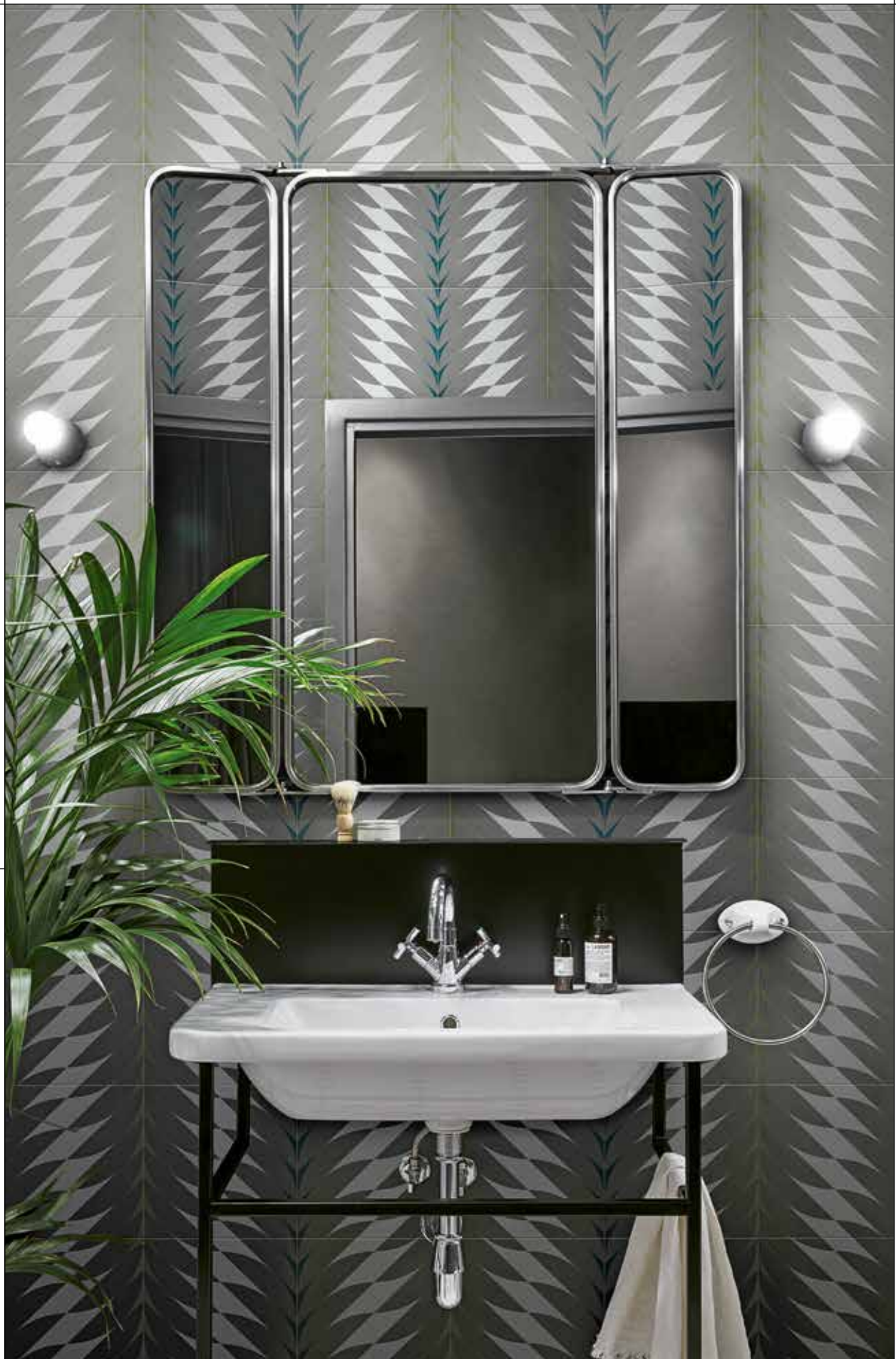
BAGNO/BATHROOM, FLEURS 4A-4B Rivestimento posa a campo pieno / Covering, all over layout