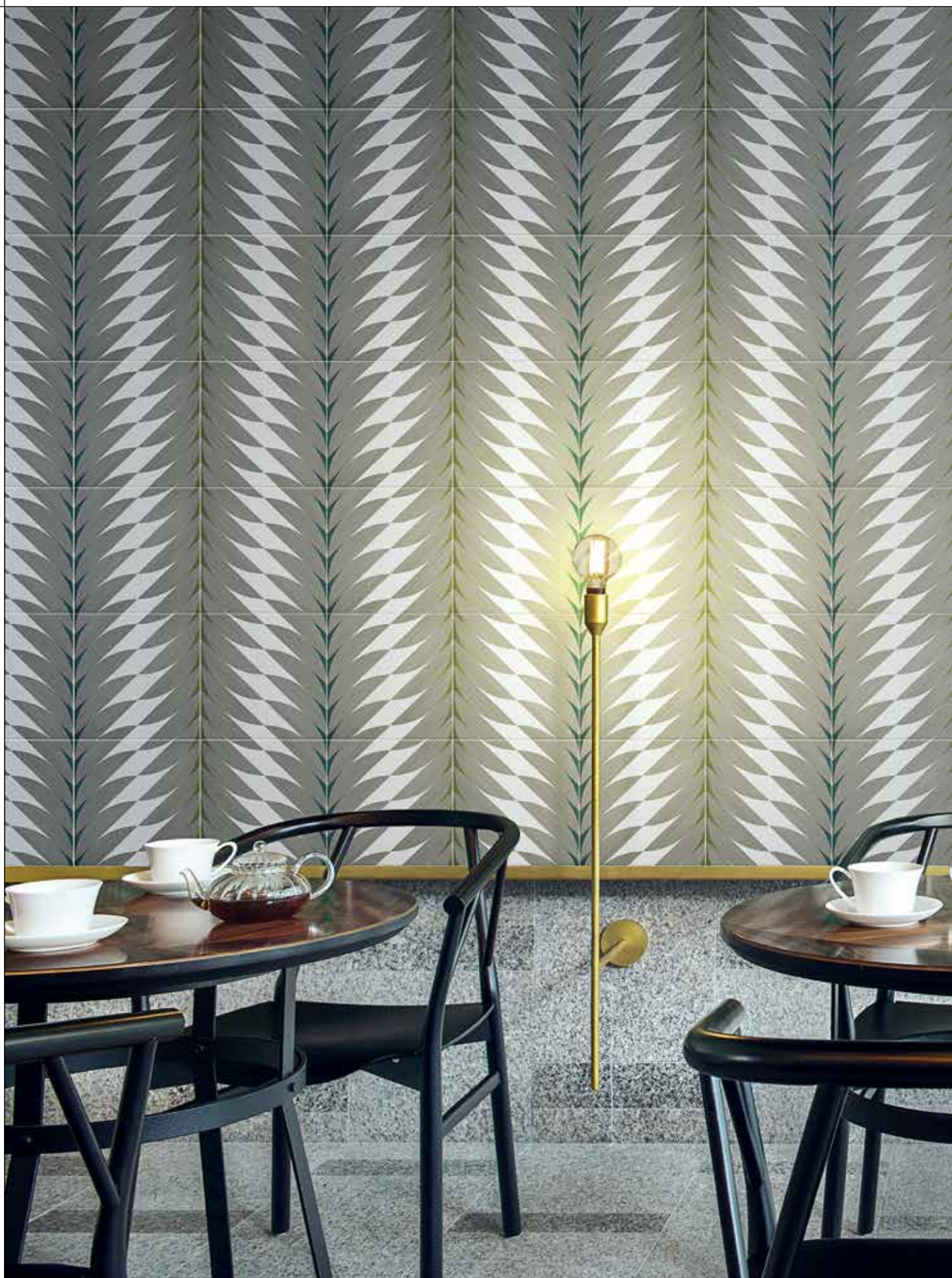
CONTRACT, FLEURS 4A-4B Rivestimento posa a campo pieno / Covering, all over layout